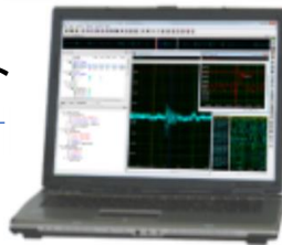
PC + SBench6

SBench6を用いてLAN経由で、それぞれの計測条件をコントロール、計測結果表示+演算/報告書へ