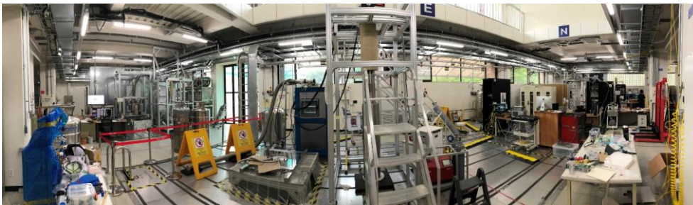
図 3 : CAPP 実験ホールでは、複数の暗黒物質探索実験を同時に設置し、運用することができます。実験室には、並列に実験装置を設置するための 7 つの低振動パッドと、複数の冷凍機、超伝導マグネットが設置されています。

DAQ システムのもう 1 つの課題はデータの後処理です。これには、単位変換、オンライン FFT、平均化、およびパワースペクトルのディスクストレージへの書き込みが含まれます。後処理時間のほとんどはオンライン FFT に費やされます。アクションハロスコープの実験では、アクションの質量が不明のため、ほとんどのケースで異なる共振周波数のデータが必要になります。また、さまざまな理由から、各共振周波数のデータは異なるタイムスタンプでいくつかのサブセットに分割されることがあります。そのような場合、次のデータを取得している間に後処理を並行して実行できます。幸いなことに、スペクトラム社のデジタイザには、さまざまなプログラミング言語をサポートするドライバが付属しています。そのうちの 1 つが Python 用ドライバです。Python のマルチプロセッシングモジュールは、このようなアプリケーションに最適であることから、上記の現象を実証するために使用されました。